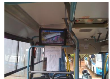
Montagem com 1 monitor de 19.5"