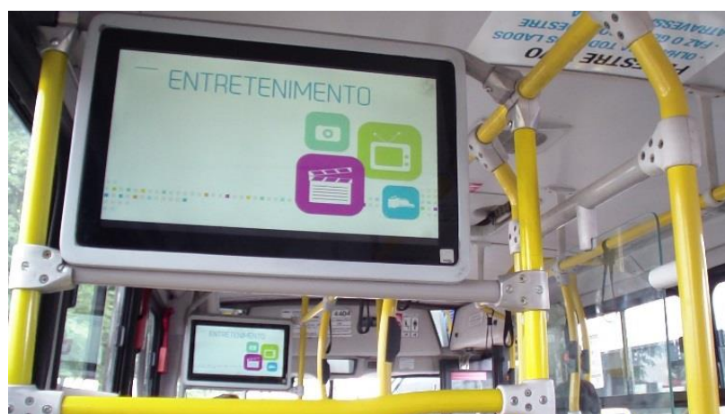
Instalação em ônibus-SP com 2 monitores de 21,5"