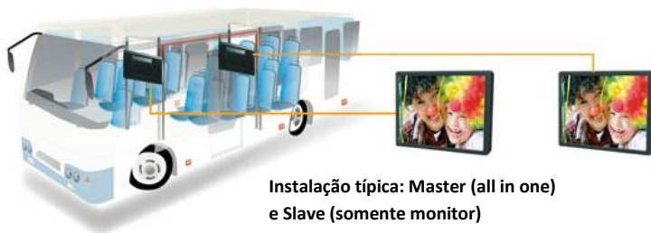
Instalação típica: Master (all in one) e Slave (somente monitor)

OIM-195BCL - Monitor veicular de 21.5" com player embarcado.