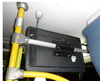
Montagem do suporte direto no balaústre sem caixa de proteção