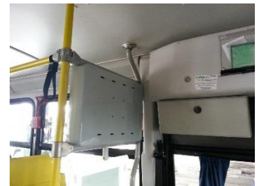
Montagem do monitor com caixa de proteção (exigência SPTrans)