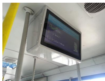
Montagem "Back-to-Back" com 2 monitores de 21,5"