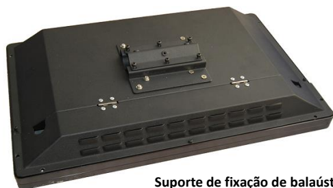
Suporte de fixação de balaústre incluso